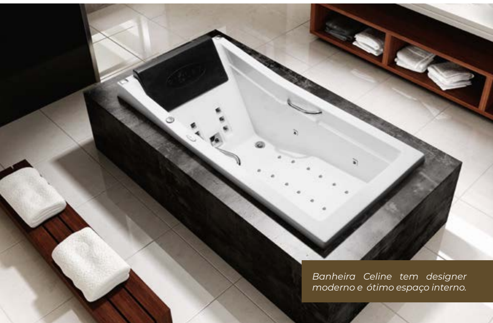
Banheira Celine tem designer moderno e ótimo espaço interno.

A inspiração e a homenagem vão muito além do nome, a banheira tem diferenciais exclusivos que conquistaram o mercado e fizeram do produto um dos mais vendidos da Rede, também