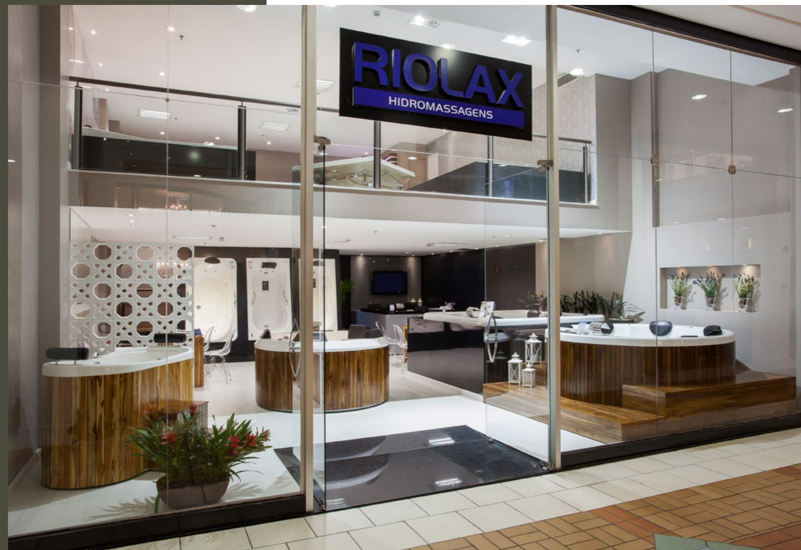
Detalhes da franquia Riolax, em Brasília